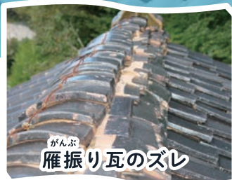
がんぶ 雁振り瓦のズレ