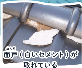
めんど 面戸(白いセメント)が 取れている