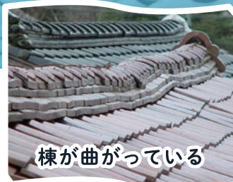
棟が曲がっている