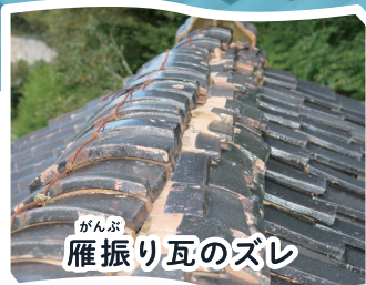
がんぶ 雁振り瓦のズレ