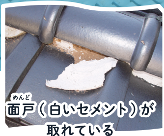
めんど 面戸(白いセメント)が 取れている