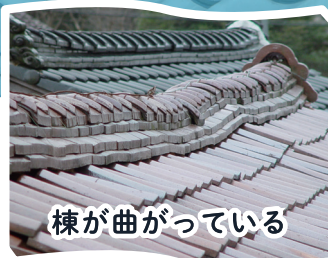
棟が曲がっている